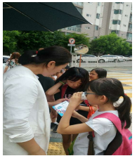
하나님! 전도의 문을 열어주소서