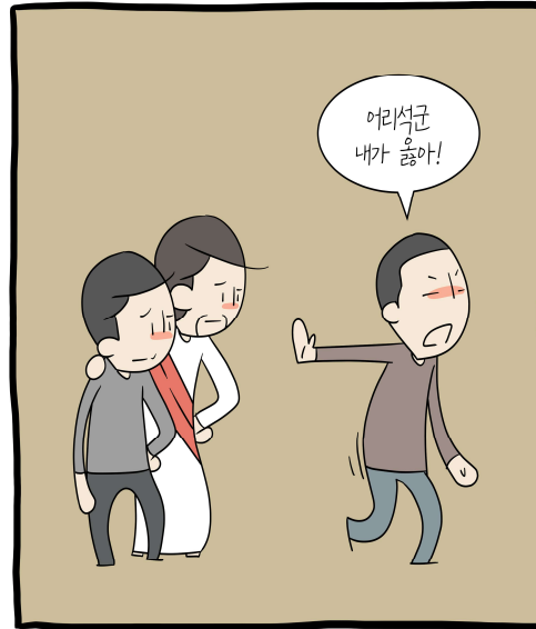
자혜가 없으면 자혜신 주님을 거절하는 것에서 시작된다.