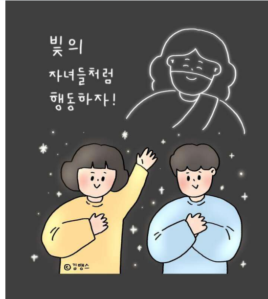
너희가 전에는 어둠이더니 이제는 주 안에서 빛이라 빛의 자녀들처럼 행하라 (엡5:8)

For once you were full of darkness, but now you have light from the Lord. So live as people of light! (Ephesians 5:8, NLT)